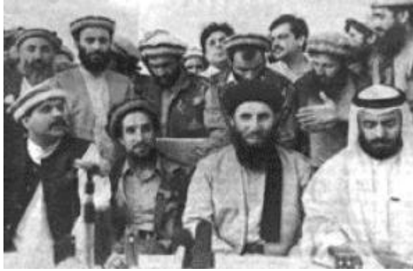
Ahmed Shah Massud e Gulbuddin Hekmatyar

La resistenza afghana nella guerra contro i Russi (1979/1989) era composta da 10 movimenti: 3 shiiti con base a Quetta e 7 sunniti, con base a Peshawar (Pakistan). Sui 7 movimenti sunniti, 4 erano detti islamisti , e ricevevano a questo titolo il 90% del sostegno finanziario.